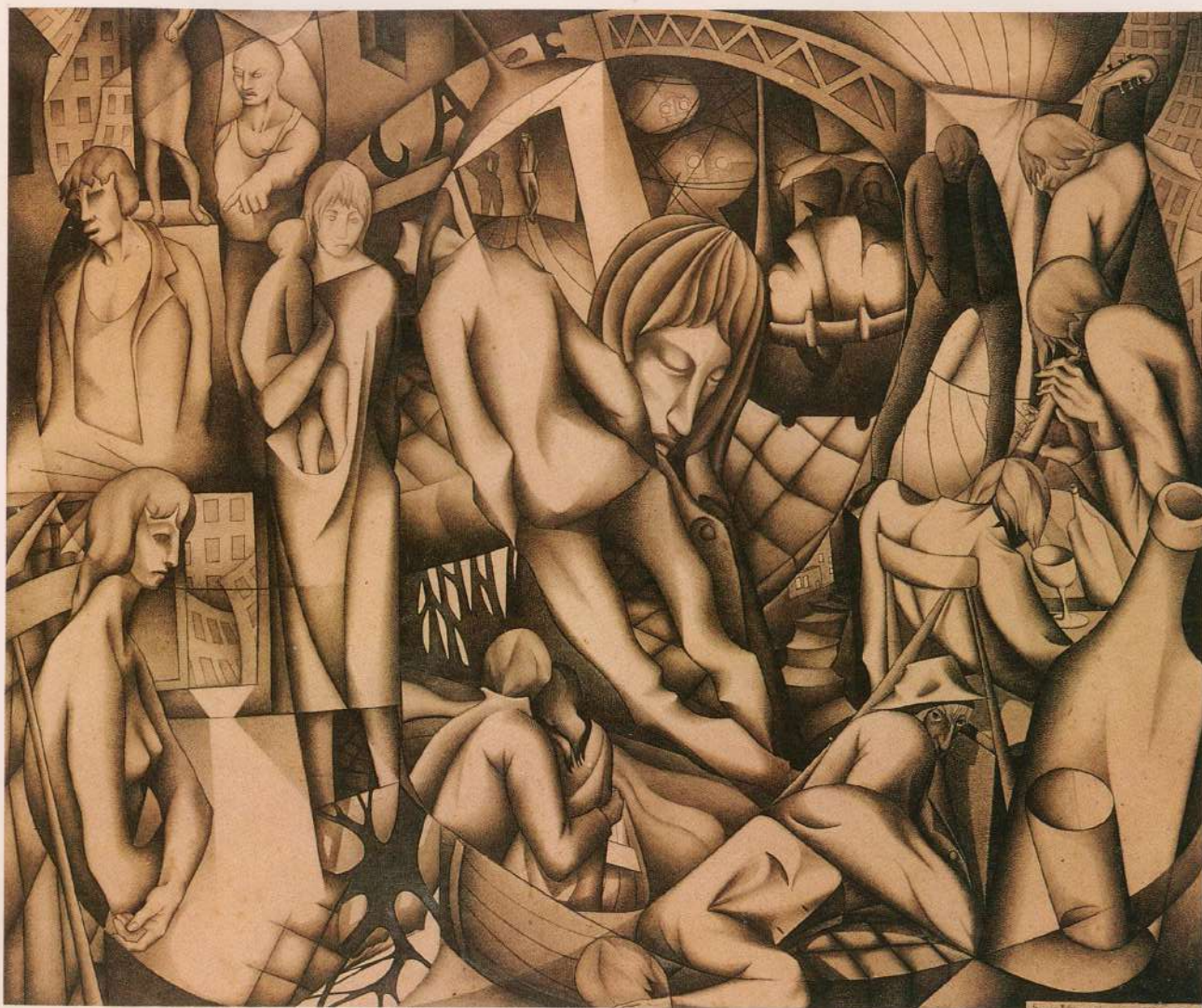
DESENHO 1956 83x95cm Coleção Waldemar Herman