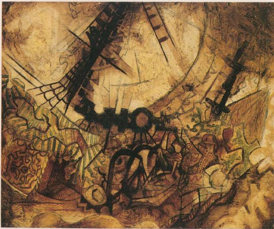
BARCO 1958 28x32cm Coleção S. Portugal Gouveia