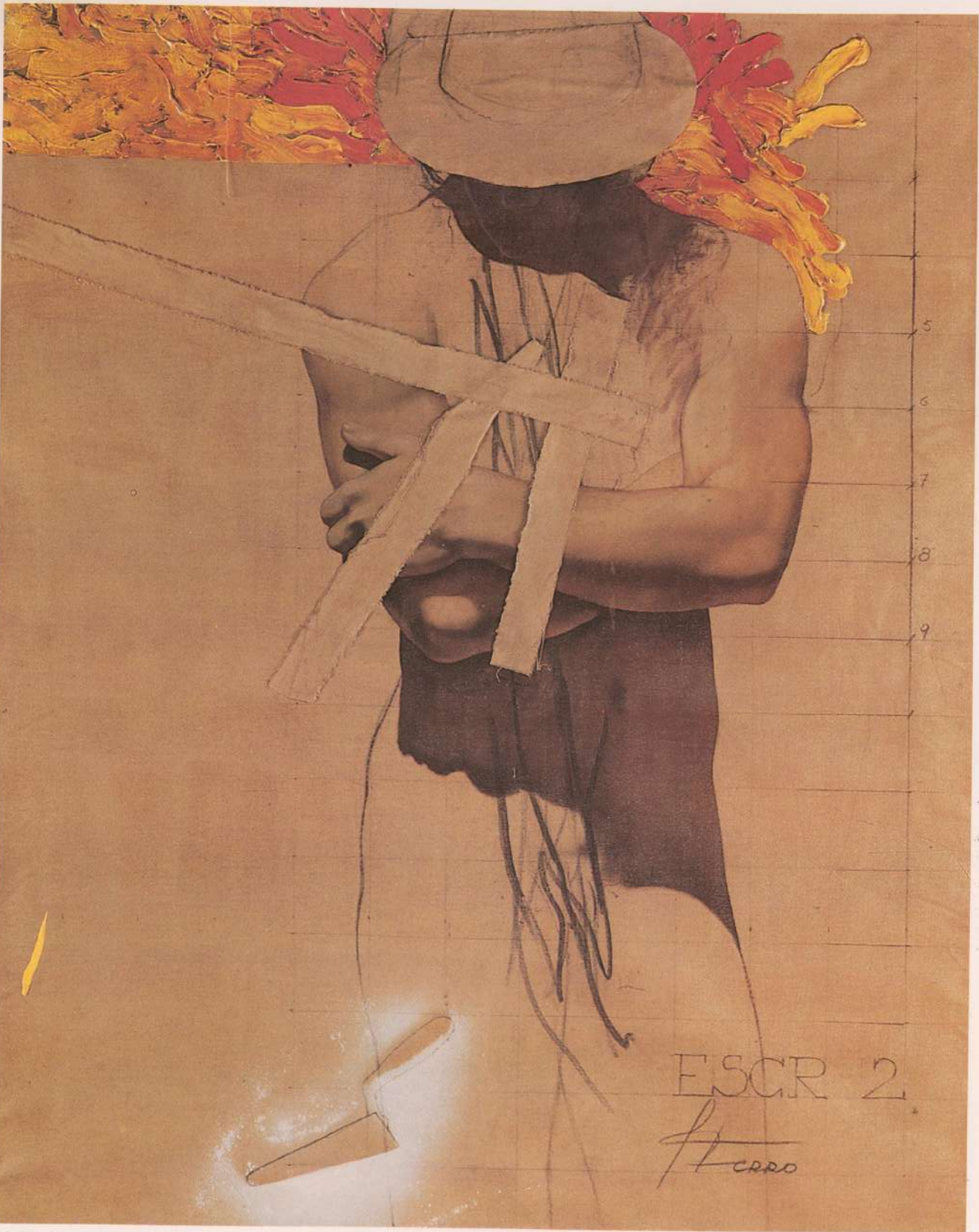
ESCRVO II 162x130cm Coleção Particular