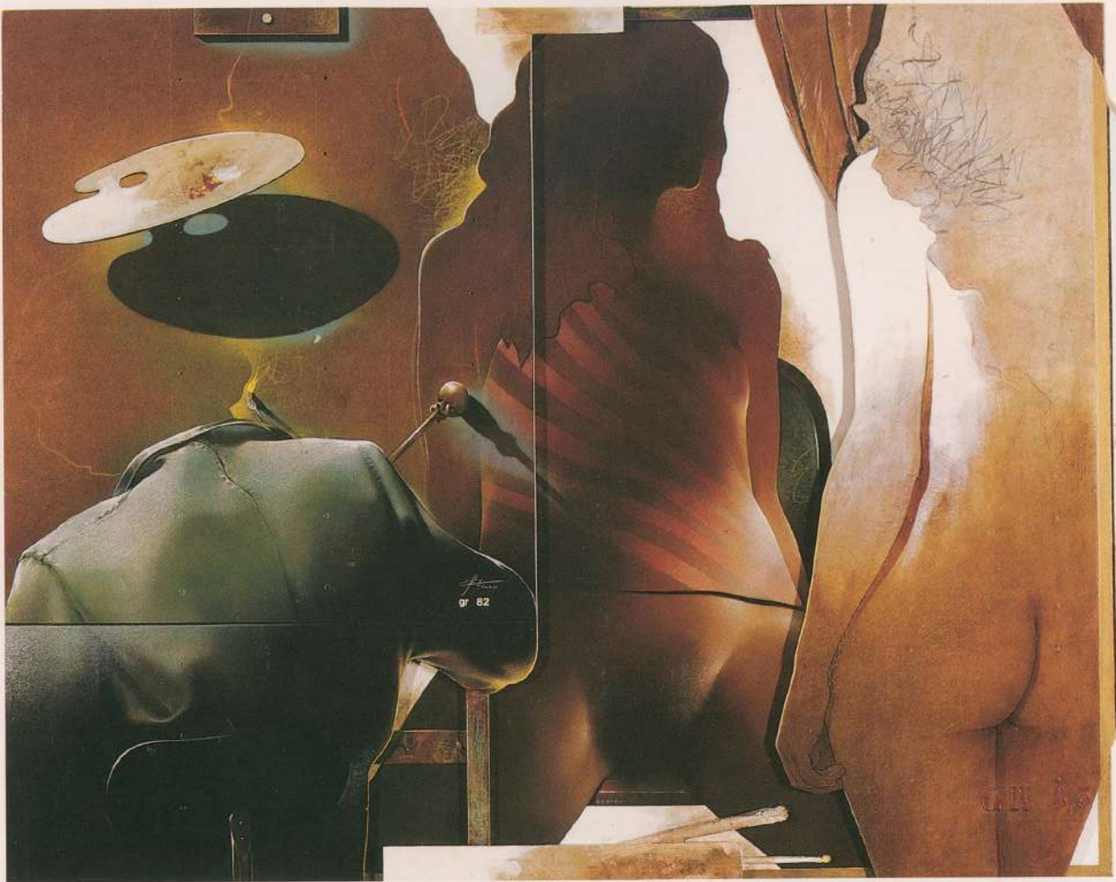
PINTOR E MODELOS 1982 130x160cm Musée de Grenoble