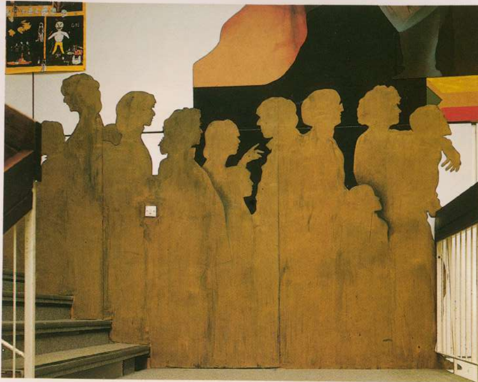
MURAL "ECOLE DES BUTTES" 1981 Detalhe França Grenoble