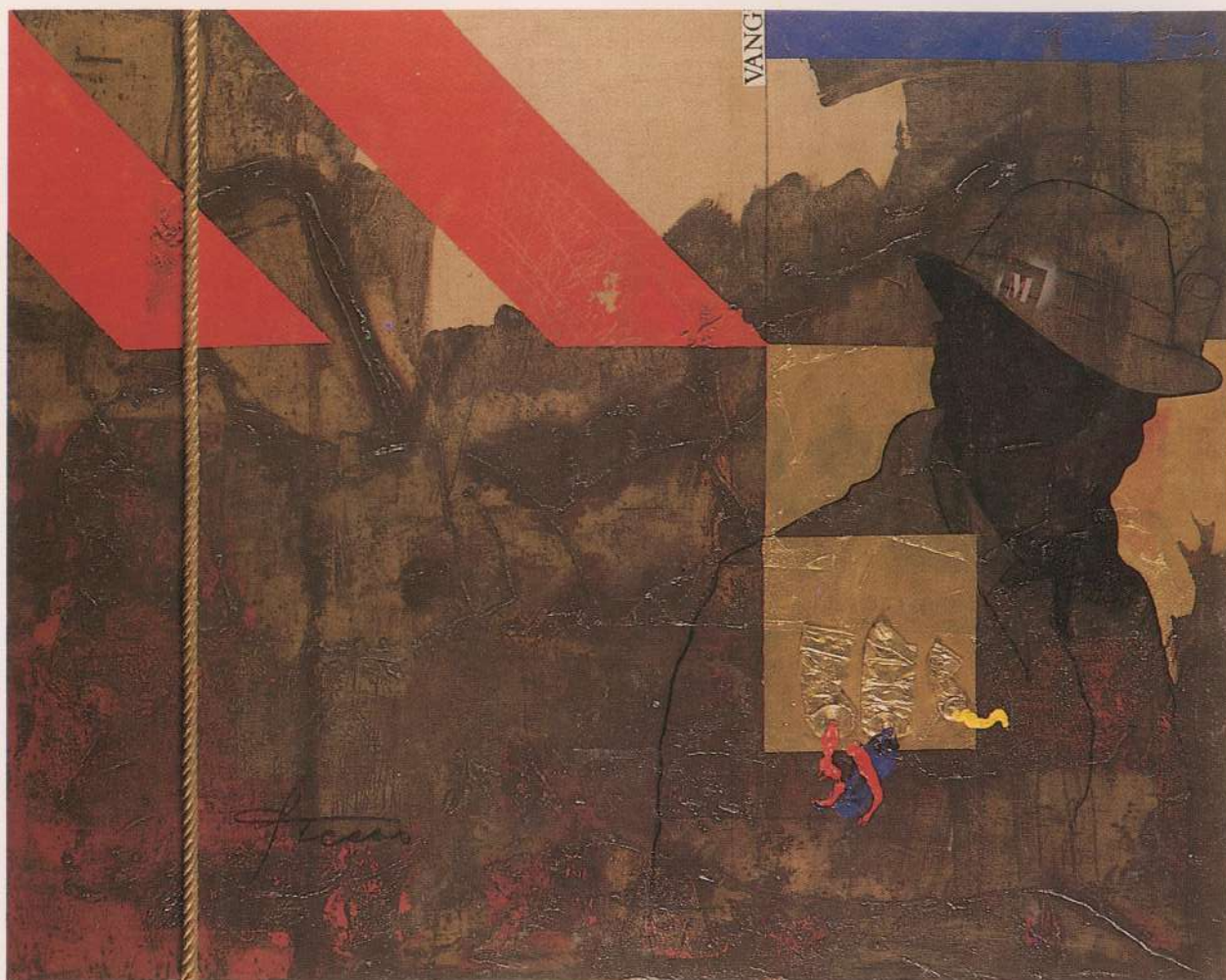
VAN GOGH EM LONDRES 1978 115x146cm Coleção Particular