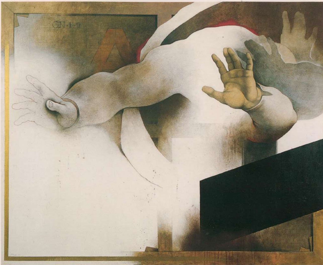
3º DIA DA CRIAÇÃO 1981 131x163cm Coleção P. Repelin