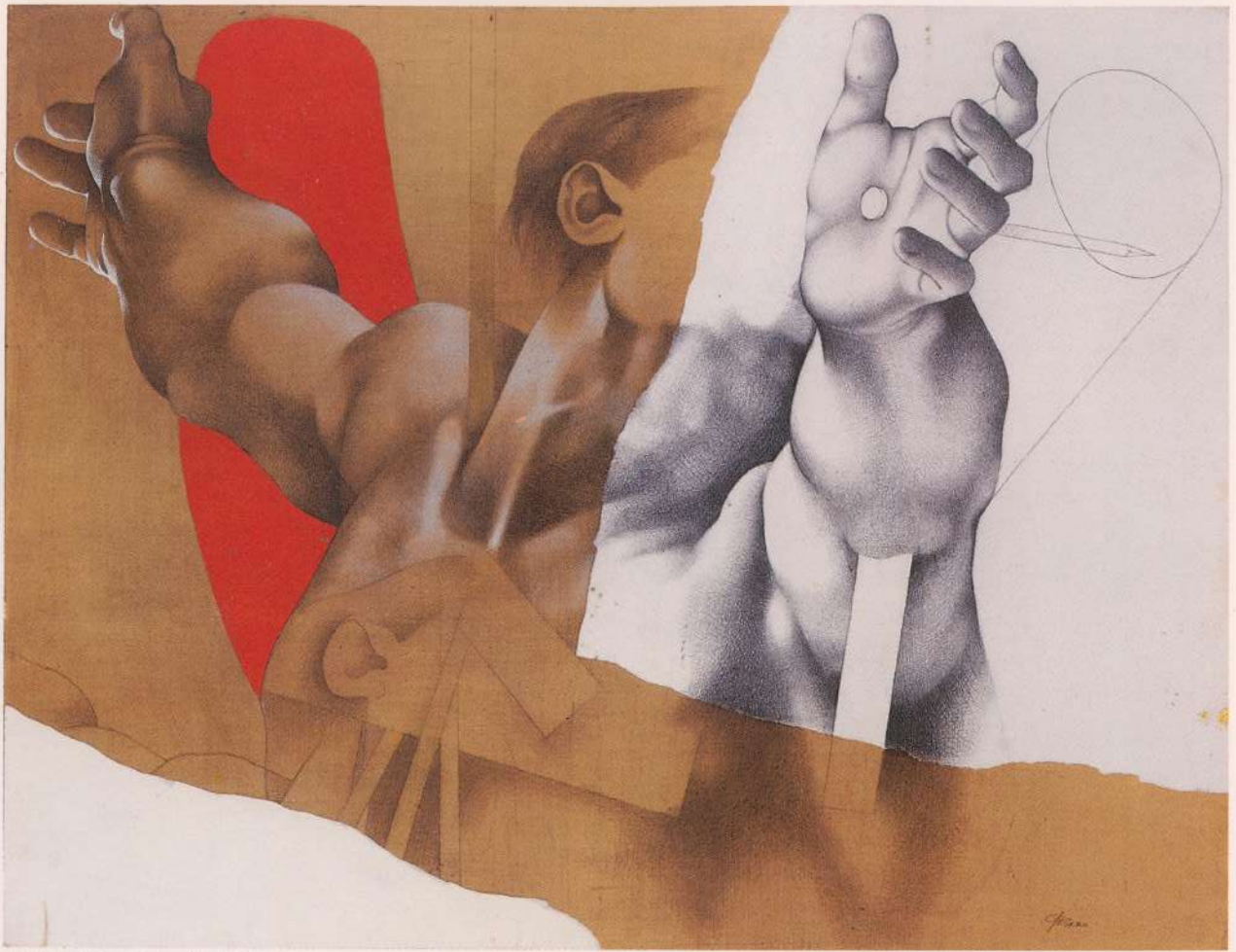
AMAN Original Serigrafia 1979 36x51cm Coleção A. Faure