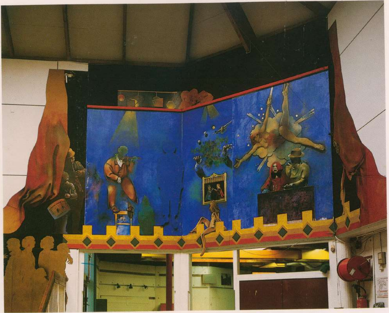
MURAL "ECOLE DES BUTTES" 1981 85m 2 França Grenoble