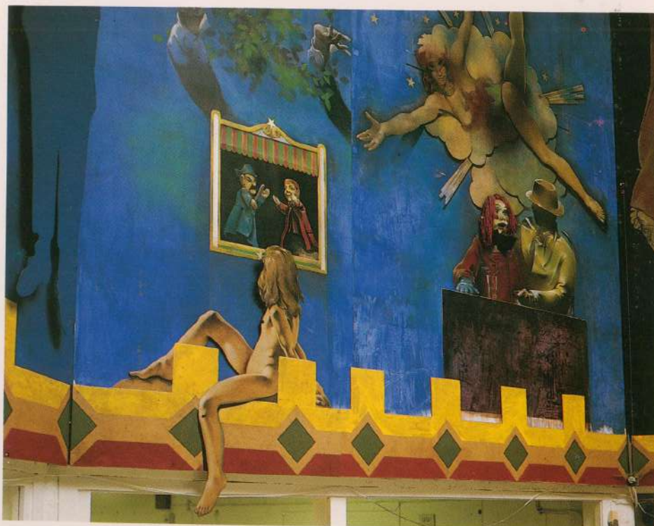
MURAL "ECOLE DES BUTTES" 1981 Detalhe França Grenoble